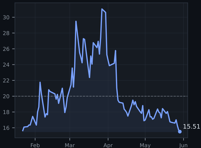
VIX (vol. equity)