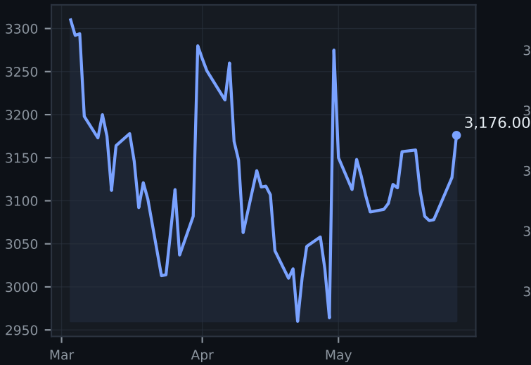
SOFR Volume ($B)