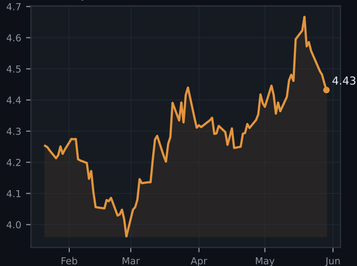
US10Y yield (%)